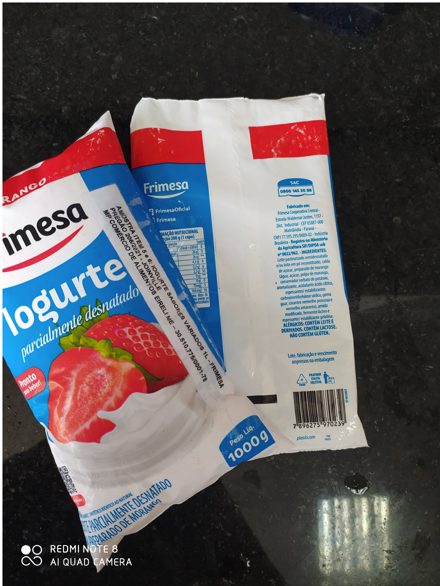
Figura 1 - Composição do produto iogurte Sabor Morango entregue pelo fornecedor