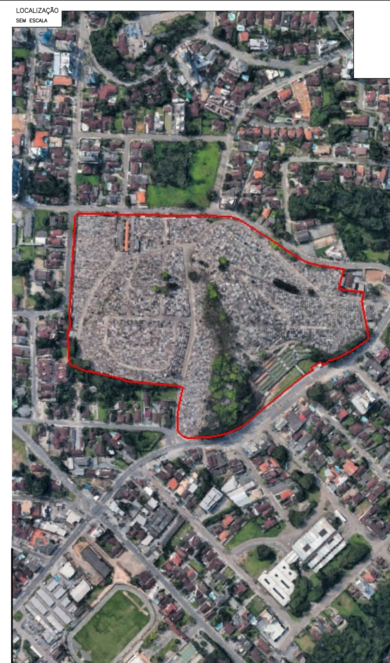
LOCALIZAÇÃO DA ESCOLA