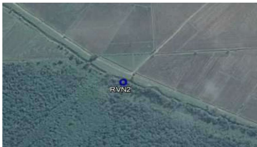
Figura 1 – Localização do ponto de amostragem

Data da coleta: 27/03/2017 Hora da coleta: 09h:30min