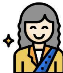
REPRESENTANTE DE ENTIDADE (CANDIDATO)

Fazer inscrição online até 12/06, às 23h59